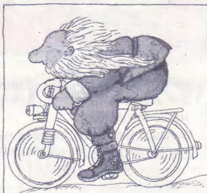
Bildquelle: Paul Maar, „Von Weihnachtsmäusen und Nikoläusen“