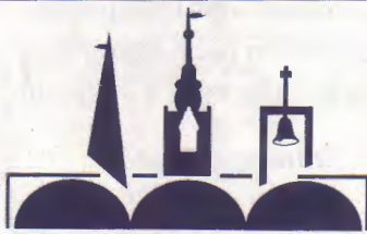
Bestattungshaus in Wahren

Die gute städtische Lage, verbunden mit dem grünen Umfeld machen diesen Wohnstandort so attraktiv. Aufgrund verschiedener Grundrissvarianten sind die Häuser für unterschiedlichste