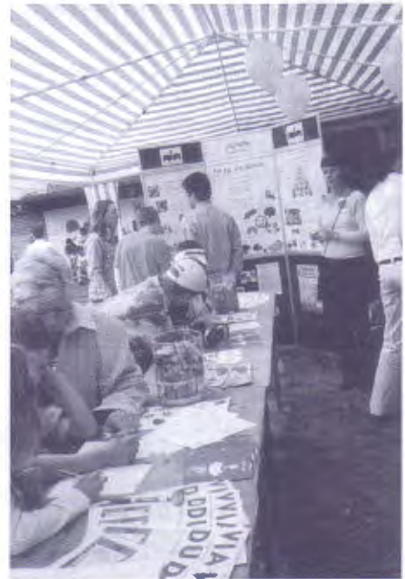
VIADUKT / 3 / N° 77