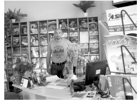
Coupon für Messerabatt, Halle 5 / J47

die zum Schluss eine Fusion zur Folge hatte und nun profitieren beide voneinander. Wenn mal einer von beiden auf Gruppenreise ist, wird der Kunde immer Kompetenz erfahren. Und damit sich auch noch viele neue Kunden an diesem Service erfreuen können, hat sich die neue Firmierung Leipzigtravel – Reisebüro am Kaufmarkt entschlossen, auf der diesjährigen Touristik- und Caravan - Messe mit einem eigenen Stand präsent zu sein. Natürlich werden sie dort für das Jahr 2008 viele schöne Reiseangebote parat haben. Frau Schneider hat viele Gruppenreiseziele für alle Altersklassen und auch für Ferienzeiten erarbeitet und freut sich schon heute, vielleicht mit Ihnen vom 24.08. – 02.09.08 mit einer Flusskreuzfahrt auf der Wolga von St. Petersburg nach Moskau zu schippern. Also, wenn wir Sie jetzt neugierig gemacht haben, dann besuchen Sie schon bald das freundliche Reisebüro am Kaufmarkt und warten nicht erst auf den Ansturm zur Messe (Stand: Messehalle 5/J 47 – gegenüber vom Stand „Ägypten“)! Nutzen Sie den Vorteil der Nähe. Reisebüro am Kaufmarkt