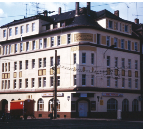
1991 besaß die Fassade ein farblich verändertes Aussehen, die Balkons waren abgebaut.

vom 16.-19. Oktober 1813 aufgestellten Gedenksteine.