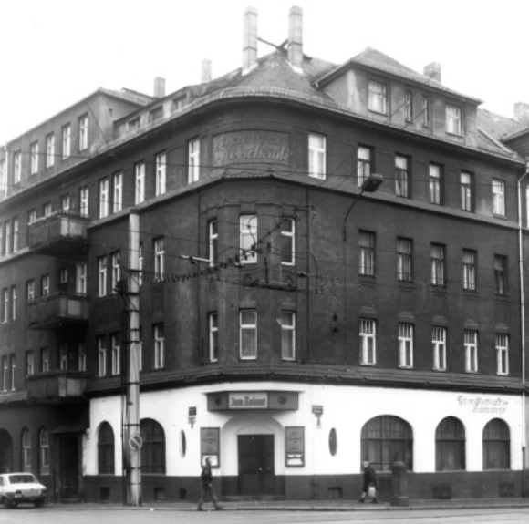
Die Seelenbinderstr.15 im Dezember 1989.