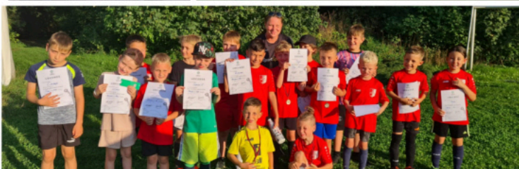
Ablegung DFB Fußball Abzeichen am 23.08.2023 und Trainingscamp F-Jugend