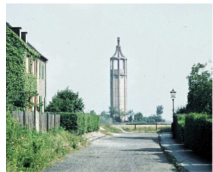
Der Stinkturm im Jahre 1968 – Blick aus der Freirodaer Straße.

Jetzt war für die Jungens aus der Umgebung die Gelegenheit für eine echte Mutprobe gekommen: Es galt, eine Lücke in diesem „Duschvorhang“ zu