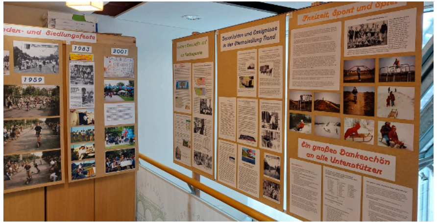
Blick in die Ausstellung

Bereits in der Dezemberausgabe 2023 des VIADUKT berichteten wir über die Ausstellung zum 90-jährigen Bestehen der Sternsiedlung Nord in Möckern und Wahren, die im Garagenhof am Rande der Siedlung durchgeführt wurde und regen Zuspruch fand. Um weiteren Interessierten die Möglichkeit zu geben, die Geschichte und Architektur dieser Siedlung kennenzulernen, hat der Bürgerverein Möckern/Wahren die obere Galerie seines Vereinsbüros umgebaut und somit dauerhaft für Ausstellungen jeglicher Art zur Verfügung gestellt.