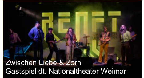
Zwischen Liebe & Zorn Gastspiel dt. Nationaltheater Weimar

Renftstraße 1 - 04159 Leipzig www.anker-leipzig.de e-mail: info@anker-leipzig.de