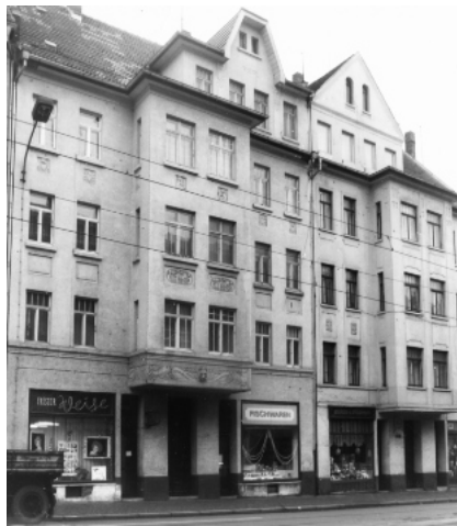
Die Häuser Georg-Schumann-Str.193 und 195, Foto Dezember 1989