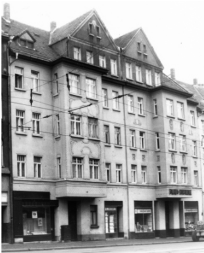
Die Häuser Georg-Schumann-Str.189 und 191, Foto Dezember 1989 (Quelle: Archiv Kohlwagen)