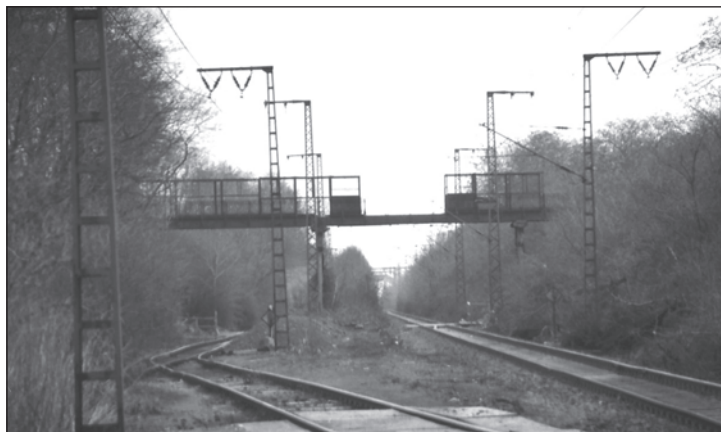
„Die alte Fußgängerbrücke beim Abriss“

„Gegen die Anlage einer Längenstraße ... und Fortführung derselben über die Magdeburgerbahn zum Zwecke der Verbindung mit der Carolastraße (die jetzige Faradaystraße.