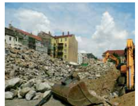
Noch werden die Trümmer beräumt – doch was wird dann ?

In den nachfolgenden Jahrzehnten verfallen die Gebäude zusehends.