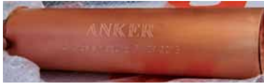
Kapsel für die Grundsteinlegung

Seit Baubeginn 2014 ist bis zum voraussichtlichen Bauende Mitte 2017 noch viel zu tun. Insgesamt werden rund 5,2 Mio Euro verbaut werden, wobei die denkmal-