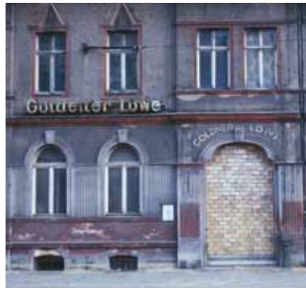
Der „Gold(e)ne Löwe“ im Jahre 1990.

stück, er erhält Gast- und Tanzwirtschafts-erlaubnis.