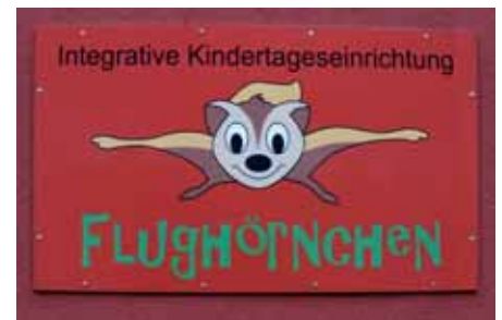
An der Hauswand: ein Bild des Namensgebers der Einrichtung