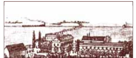
Aus einer Werbung der Heilanstalt Dr. Kern 1896