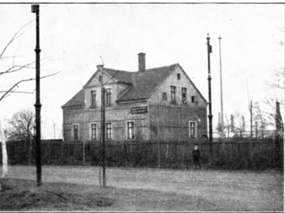
Die Gärtnerei Wagner um 1880. Im Hintergrund sind die Schornsteine der Gewächshäuser zu sehen. Die Aufnahme ist nicht datiert.