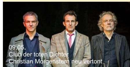
09.05. Club der toten Dichter Christian Morgenstern neu vertont