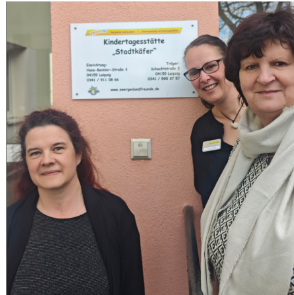
Text: Michael Schmidt

Wir als Bürgerverein gratulieren der Kita und ihrem Team herzlich und Danken für das Engagement für die Kinder!