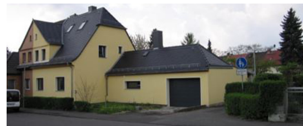
Heutiger Zustand Finkensteig 13 (Der ausgeschilderte Fußweg im Bild führt zum Treppenaufgang)