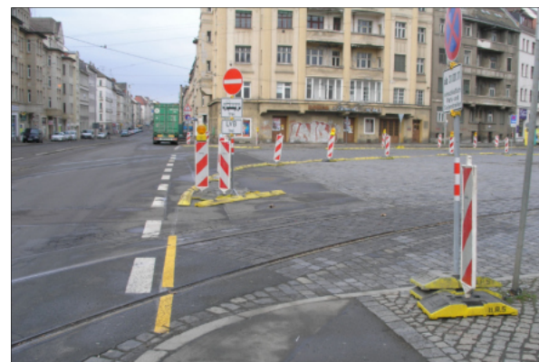
Im Jahr 2011 wird die künftige Ausdehnung des Huygensplatzes provisorisch angezeigt