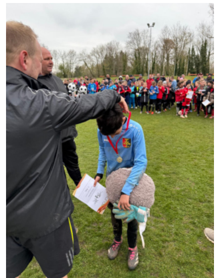
Text/ Bilder: Pressewart des TSV 1893 Leipzig-Wahren e.V.