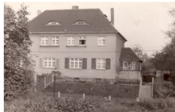
Haus in der Tannenwaldstr. mit Bodenlichtern (Fledermausaugen) und Stegfenstern (Historisches Foto mit Glaslaterne als Straßenbeleuchtung)

tung war das Fensterputzen dabei etwas aufwendiger, da je Fenster zwölf kleine Scheiben gereinigt werden mussten. An vielen Fenstern, insbesondere den unteren, befanden sich Holzfensterläden (siehe Bild), die in der Nacht, bei Kälte oder starker Sonneneinstrahlung geschlossen wurden. Die Wandhaken zur Befestigung hatten die Form eines Frauenskopfes.