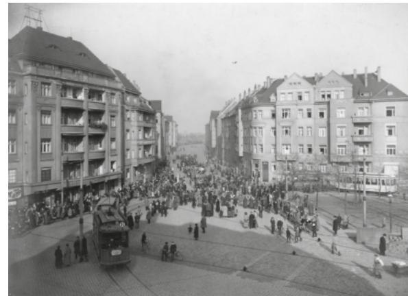
Blick über den „Huygensplatz“ im Jahre 1925. Am 31.10.1925 versammelten sich viele Einwohner Möckerns, um die drei neuen Glocken für die Auferstehungskirche in Empfang zu nehmen.