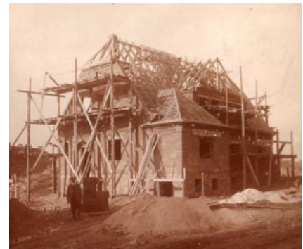
Bauphase Finkensteig 11 (vorn) und 13

Typisch für die Doppelhäuser mit geknicktem Walmdach war die geschwungene Dachführung um je ein Dachfenster (sogenannte Fledermausaugen) auf der Vorder- und Rückseite. Sie wurden meist durch größere kippbare Fenster ersetzt. Die Fenster in den Wohnräumen waren Doppelfenster aus Holz mit einem Steg in der Mitte und das Oberlicht ging nach oben zu klappen. Gegenüber der heutigen Fenstergestal-