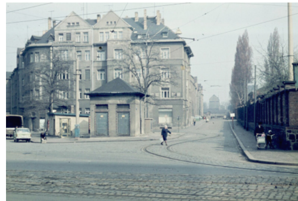
Der Huygensplatz im Frühjahr 1968 im damaligen Zustand. Neben dem Platz steht der sog. Eiswagen, der den Anwohnern regelmäßig das für ihre Eis-schränke benötigte Stangeneis lieferte.